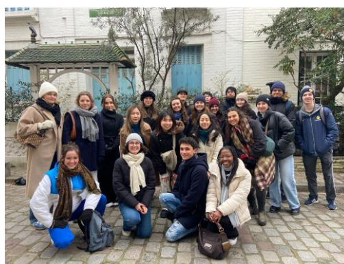
圖十七、圖十八：交換學生間的出遊

六、您對於社科院辦理與該締約學校之間的交換細節，如甄試、薦送、聯繫等事宜，您有無任何建議？