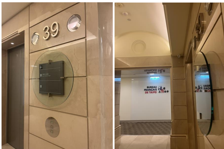
圖一、圖二：申請法國簽證的面試地點

開學約兩個月前，學校會寄信詢問是否有接機需求，不過日期選擇只有開學前的週末兩日，如果非在學校指定的接機時間抵達法國，需要自己搭乘大眾運輸（約一個半小時）或計程車（約一個小時）到住宿地點。