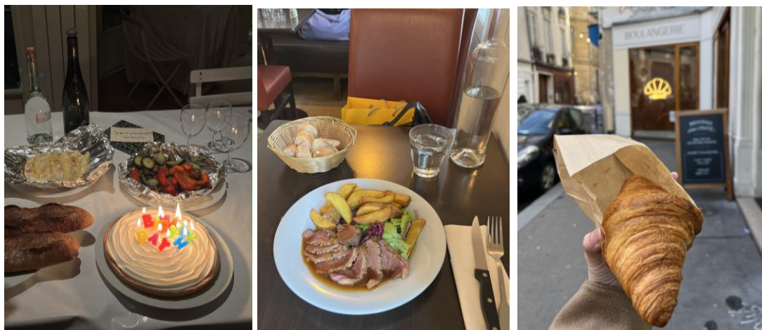
圖十四、圖十五、圖十六：巴黎的日常飲食

外食的話學校附近餐廳比較少選擇，若到聖日耳曼昂萊市區或巴黎的餐廳用餐，一餐大約 15 至 30 歐。