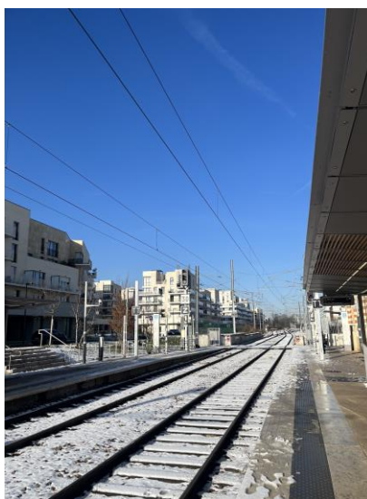
圖十二、圖十三：聖日耳曼昂萊火車站與學校附近的輕軌站