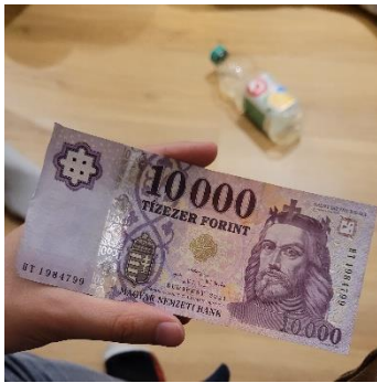
圖四：匈牙利同學分享他們國家的大值紙幣

關於社科院辦理與該締約學校之間的交換細節的建議，我認為社科院可以提供更多關於準備事項的提醒，甚至列一個表格去讓交換學生按部就班跟進，這樣一來會減少學生的焦慮與不安，二來讓學生浪費少很多時間。像出國前簽證準備的事項，如果事前學校方面有提及學生也需要向法國教育中心填線上申請表格，那學生就不會像我一樣因為不知道白去了一次，然後有出國的行程因為要等簽證而要大更動。又或是關於法國當地有 CAF 住宿津貼，也可以先讓學生提早去準備相關文件，不會少了一兩個月的津貼。