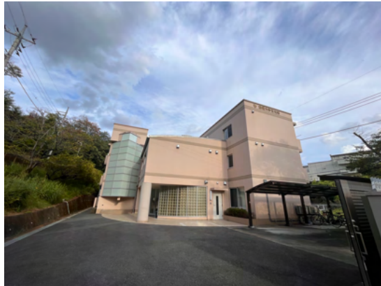
（圖二）：友光寮宿舍外部

女生交換生的住宿主要有兩間，秋桜跟友光寮，前者是單人房後者是雙人房，都距離學校徒步20分鐘。（學校會附上床具）