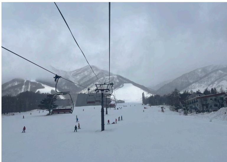
（圖五）：學校帶去長野滑雪，三天兩夜總費用共36,000日幣

學校會舉辦針對交換生、留學生的見學活動，包含去富士山、迪士尼樂園、滑雪三天三夜，由學校包車，價格也很便宜，只是都有限制人數。