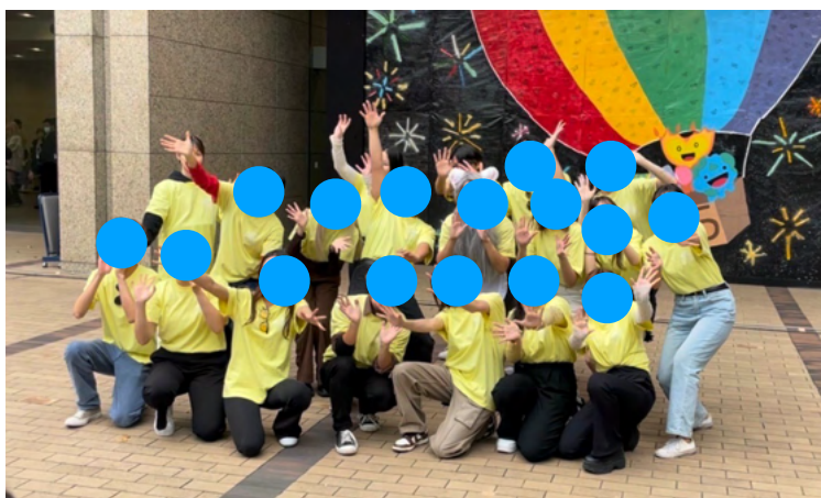
（圖四）：香港、澳門、台灣與部分日本學生一起表演

在十月有創大祭，可以加入「日スタ」，一個由所有交換生、留學生以及自願的日本學生組合而成的組織，讓交換生依照自己國家的地理位子分組，在學園祭裡面販賣自己國家的食物、飲料，並有機會教到日本朋友！