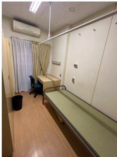
（圖三）：友光寮宿舍內部