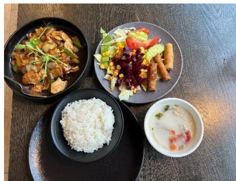
圖六：左半邊是正餐，右半邊是 沙拉吧取用內容。