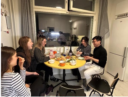
圖七：媽媽短暫來訪時，邀請新加坡朋友到住處跟室友一起吃飯。