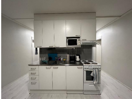
圖二：公共區域-廚房，兩側走道各有三間房間。