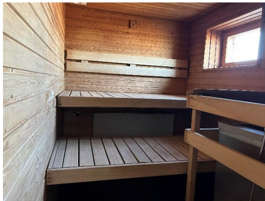
圖四：住處頂樓的小桑拿房