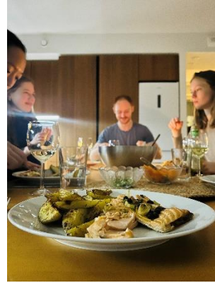
圖八：學期初，德國朋友(圖中)邀請幾位朋友到住處共進晚餐。