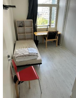
圖三：房間內部-HOAS 的房源會有完整家具，床單被套也都有。