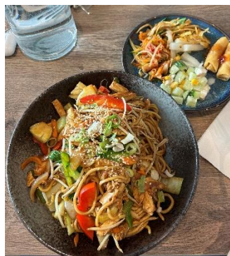
圖五：下方是正餐， 右上方是沙拉吧取用 內容。