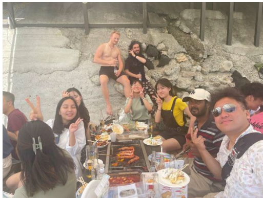
▲ LiaRis 海邊烤肉活動

阪大有一些專門辦國際交流活動的組織，我有參加的是 BSP 和 LiaRis。BSP 主要是每週辦各種語言咖啡(練習語言的活動)，每天不同的語言，每個月一次交流活動，可以挑有興趣的參加。三個校區的 BSP 行程表都不一樣，可以在他們各自的 ig 帳號上確認。LiaRis 則是新成立的組織，會辦交流活動給日本學生和國際生參加，目前的活動內容主要是一起做異國料理或出遊。