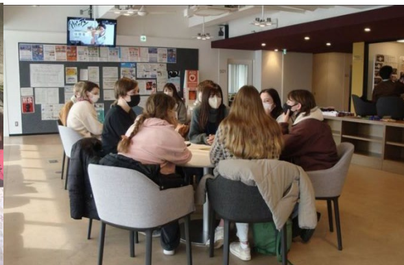
▲ BSP 德語咖啡