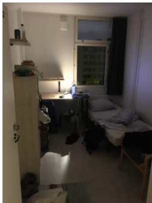
圖六、我可愛的房間