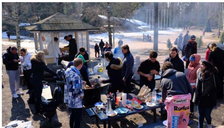
圖四、慶祝氣溫回暖(當天約6度)，去公園烤肉