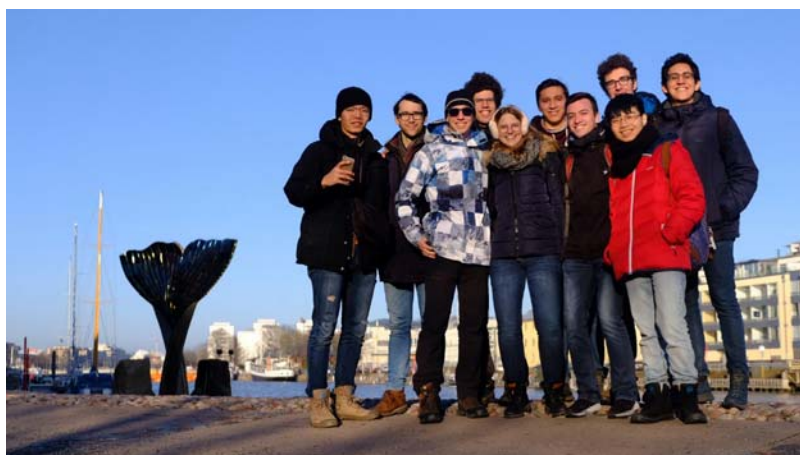
圖三、芬蘭西邊大城 Turku