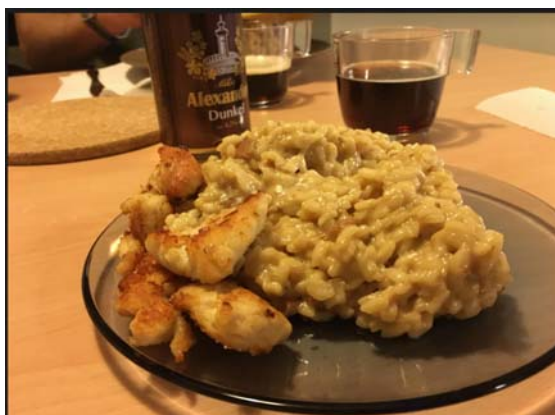
圖十、義大利朋友做燉飯，德國朋友提供啤酒、我煎雞肉

六、您對於社科院辦理與該締約學校之間的交換細節，如甄試、薦送、聯繫等事宜，您有無任何建議？