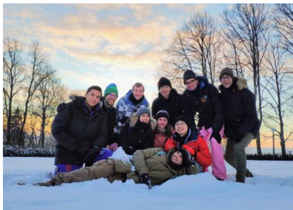
圖二、一起跟隨 ESN 前往愛沙尼亞首都 塔林

雖然說學校內有 ESN 這個學生組織，但自己本身並沒有參加，只會偶爾朋友去其所舉辦的 party 或其他活動。然而自己很幸運地交到一群來自世界各地的好朋友，易大立、德國、墨西哥等，平常中午群組就會有人問要不要一起吃飯，放學後偶爾也會一起借一間位於圖書館的討論室一起讀書寫作業，除了讀書以外也會一起參加活動、舉辦異國料理趴、喝酒或是去芬蘭其他城市旅遊，可以說是交換生活中最喜歡的一部分。就自己的經驗而言，外國的朋友其實普遍很好相處，從他們身上學到的是物價值觀更是無價的寶藏。