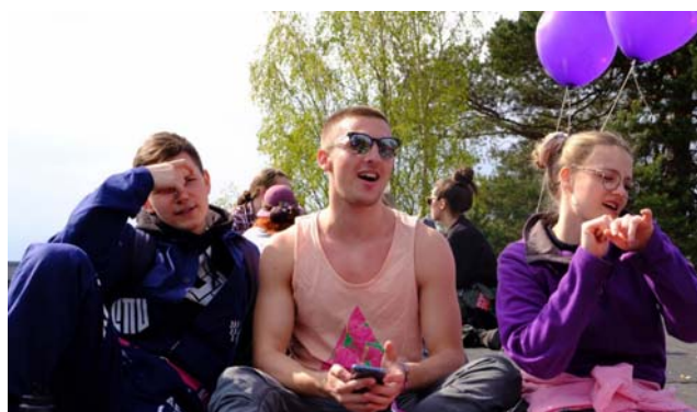
圖五、芬蘭慶典 Vappu (5/1)