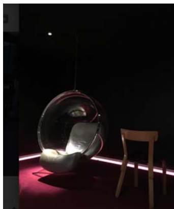
圖八、圖書館地下室的特色椅子