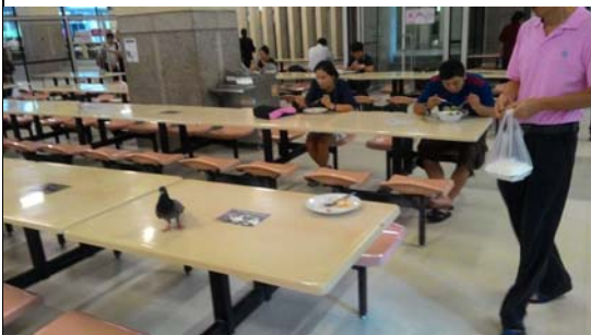
經濟院館隔壁 Mahit 大樓的學生餐廳