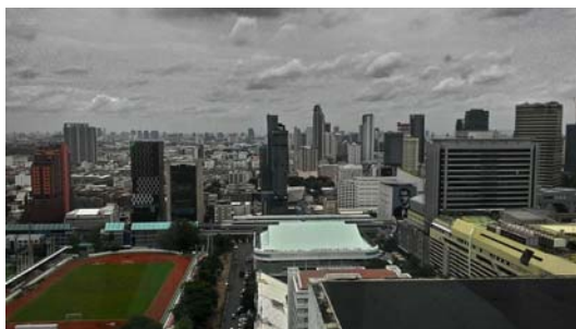
國際大樓眺望曼谷市區