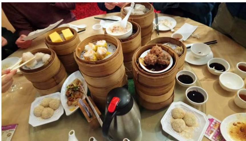
Weeks of Welcome 體驗港式飲茶

我的課餘活動大多是和室友去爬山、遊離島，香港除了繁華的都市風貌外，還有很豐富的自然環境，像是 Hiking 路線規劃的很完善，而且容易到達。這些相關資訊在香港旅遊局的網站上都有詳細的說明，我們大多都是參考網站上的介紹決定我們的行程。除了香港外，我還有到深圳、澳門、廣州、北京。廣州在香港有火車可以抵達，深圳、澳門分別搭港鐵和船都可以抵達，而且也能當天來回，如果不希望花太多錢或假期短，也可以選擇這樣的方式。