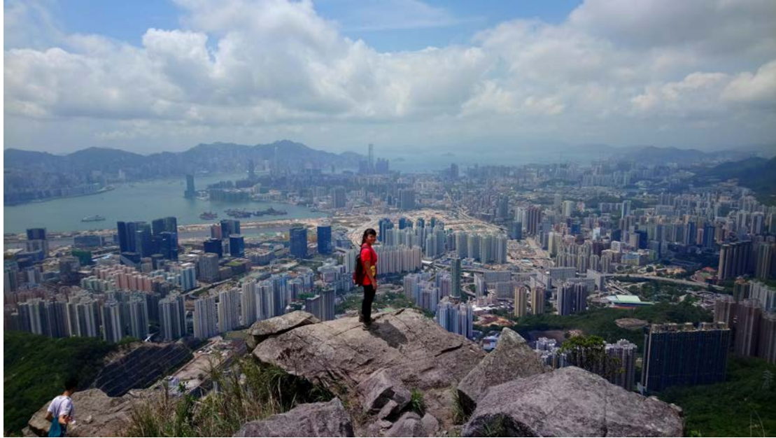
Hiking-飛鵝山 Suicide Cliff 眺望九龍