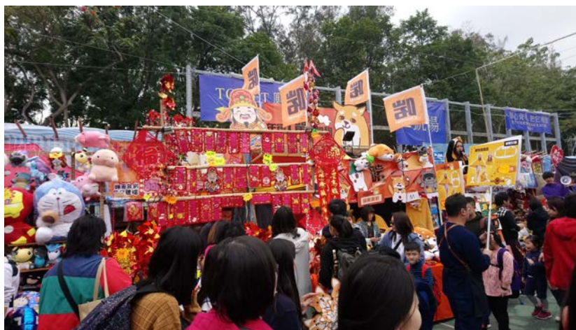
春節期間的年宵花市