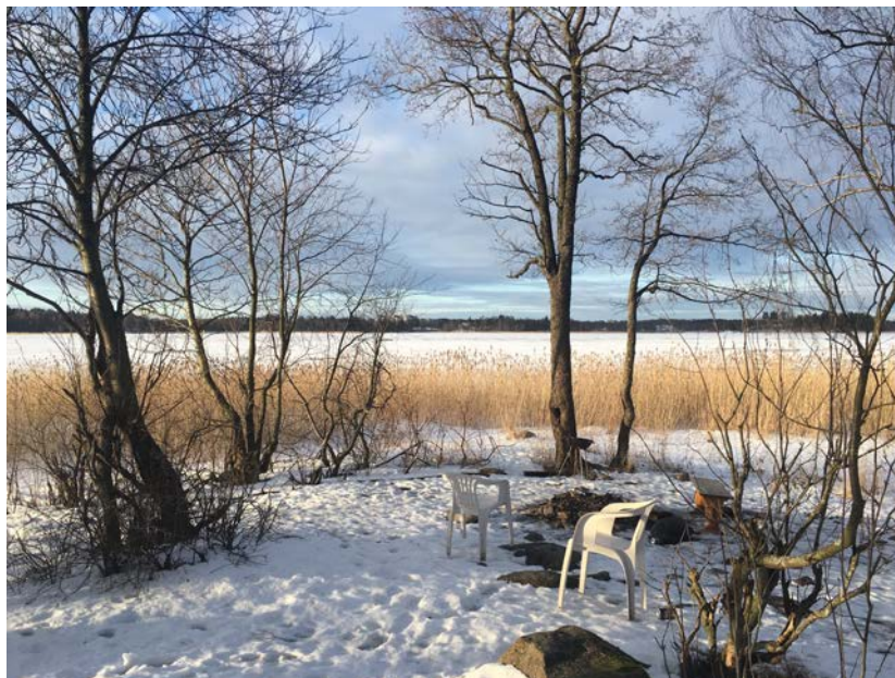
圖（三）、Aalto 校園後方的海邊