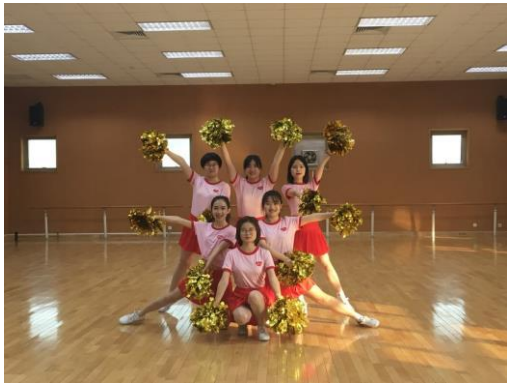
「健美操」體育課的期末發表