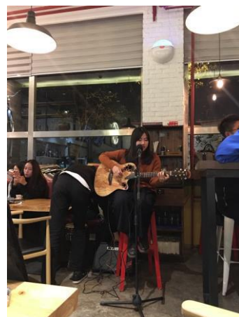
「吉他角」活動 在校園咖啡廳內駐唱