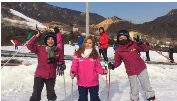
冬天到懷北滑雪場體驗滑雪