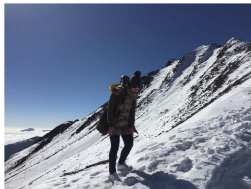
一個人到四川旅行