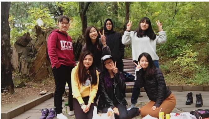
和學伴相約到香山野餐