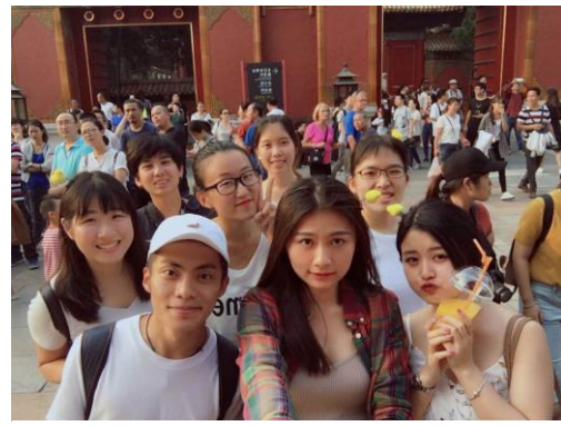
學校舉辦的故宮一日遊活動