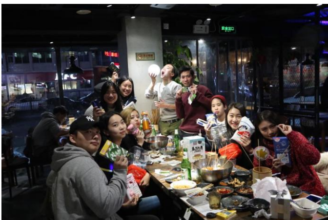
聖誕節和陸生朋友一起交換禮物